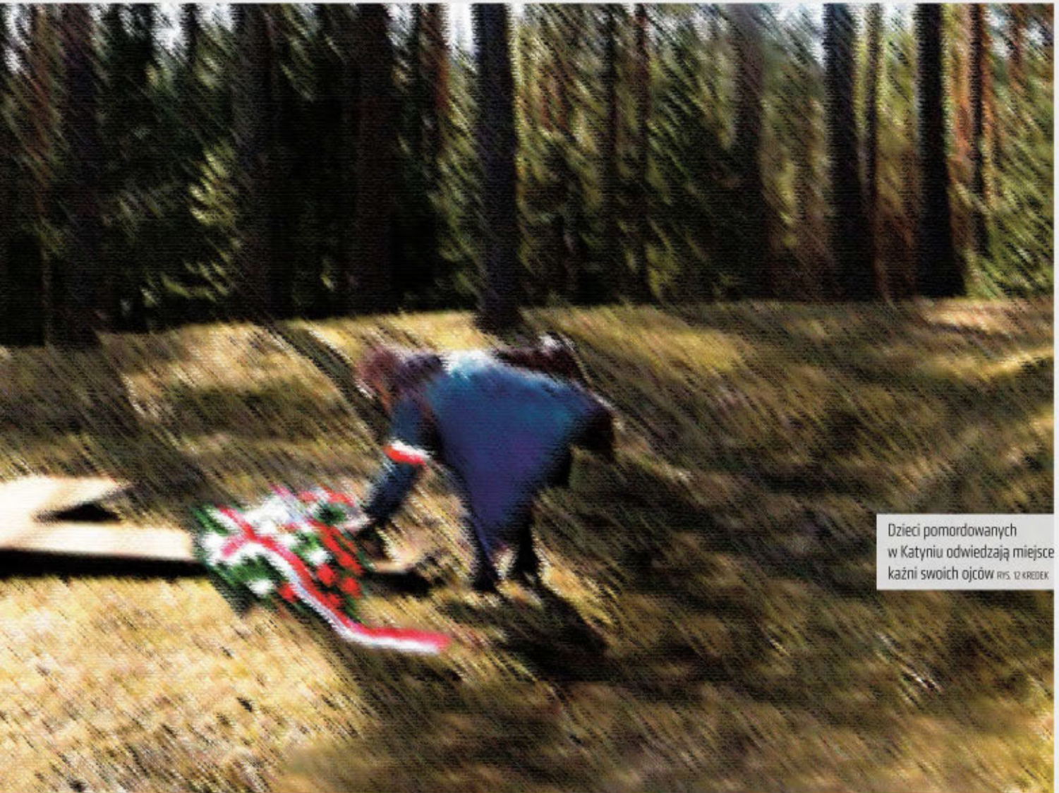
Dzieci pomordowanych w Katyniu odwiedzają miejsce kaźni swoich ojców RYS. 12 KREDEK

działam się, że został zamordowany przez NKWD strzałem w tył głowy w Bykowni.