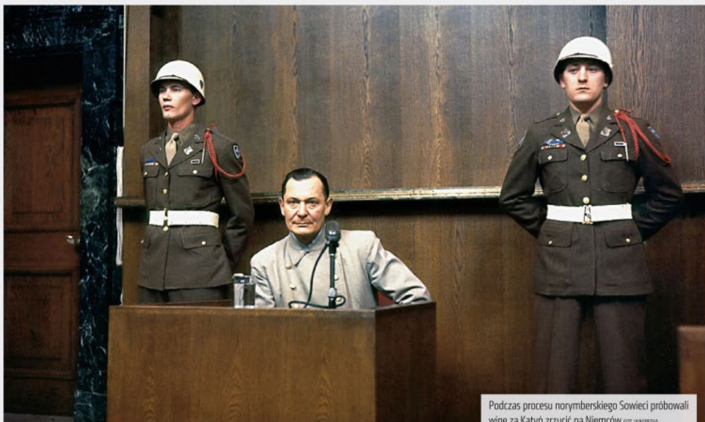
Podczas procesu norymberskiego Sowieci próbowali winę za Katyń zrzucić na Niemców.

■ Po odejściu Gorbaczowa, gdy nastąpiła era Borysa Jelcyna, dokonano kolejnego ruchu także będącego kłamstwem. W trakcie teatralnego wystąpienia w telewizji rosyjskiej ostatni przywódca ZSRS, ocierając łzy, poinformował o „odnalezieniu” decyzji politbiura KC WKP(b) z 5 marca 1940 r. o rozstrzelaniu polskich jeńców wojennych oraz dodatkowo ponad 7 tys. osób z więzień kresowych.