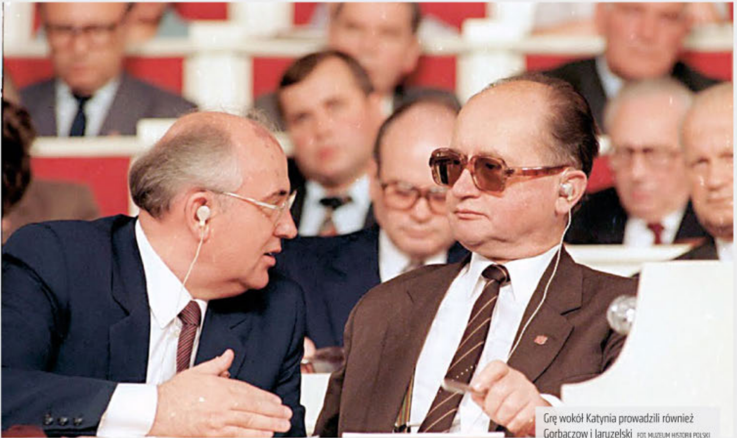
Grę wokół Katynia prowadzili również Gorbaczow i Jaruzelski