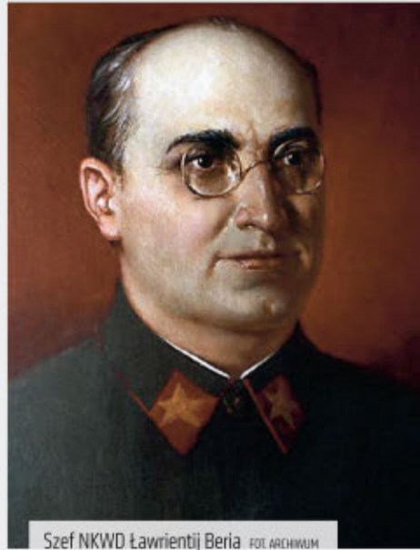
Szef NKWD Ławrientij Beria.

Jednak muszę przyznać, że większość obywateli była skłonna wierzyć władzy sowieckiej. Swoiste otrzeźwienie nastąpiło w końcu lat 80., w ostatnim okresie istnienia ZSRS, kiedy światło dzienne ujrzały dowody represji stalinowskich, kiedy zaczęto poważnie badać gigantyczną ich skalę, kiedy okazało się, że w pobliżu każdego miasta obwodowego znajdują się zbiorowe groby ofiar represji. A po uznaniu przez stronę sowiecką, że