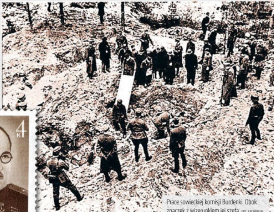
Prace sowieckiej komisji Burdenki. Obok znaczek z wizerunkiem jej szefa.

Znajdując się pod presją żywiou, jaki tworzyła antyradziecko nastawiona część emigracji londyńskiej, dokonał Sikorski kolejnego posunięcia bez rozważenia jego następstw. Opierając się na informacjach hitlerowskich i pomijając rząd