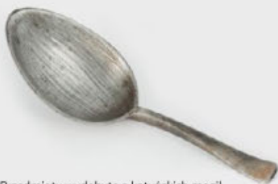
Przedmioty wydobyte z katyńskich mogił