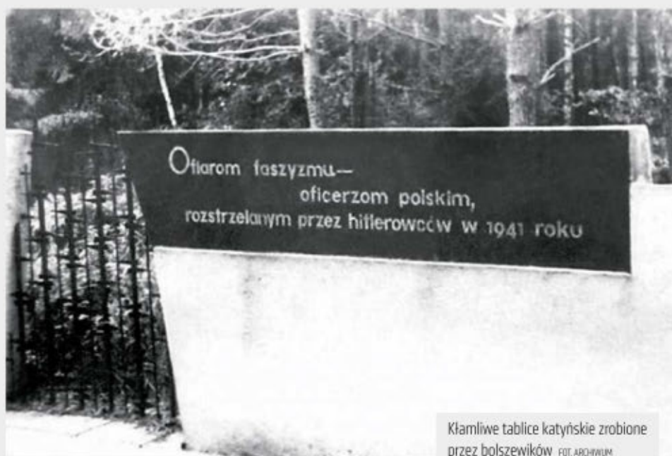
Kłamliwe tablice katyńskie zrobione przez bolszewików