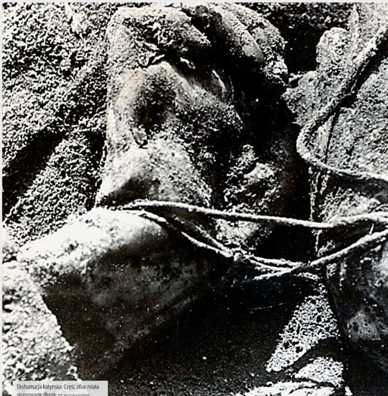
Ekshumacja katyńska. Część ofiar miała skrepowane dłonie.