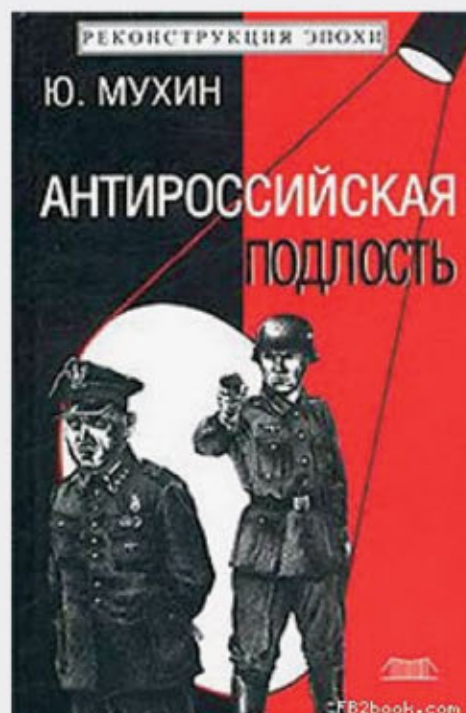
Okładka współczesnej rosyjskiej książki, której autor zrzuca winę za zbrodnię w Katyniu na Niemców.

W 1957 r. historycy nie dysponowali wiedzą o wewnętrznej organizacji struktur NKWD, stosowanych procedu-