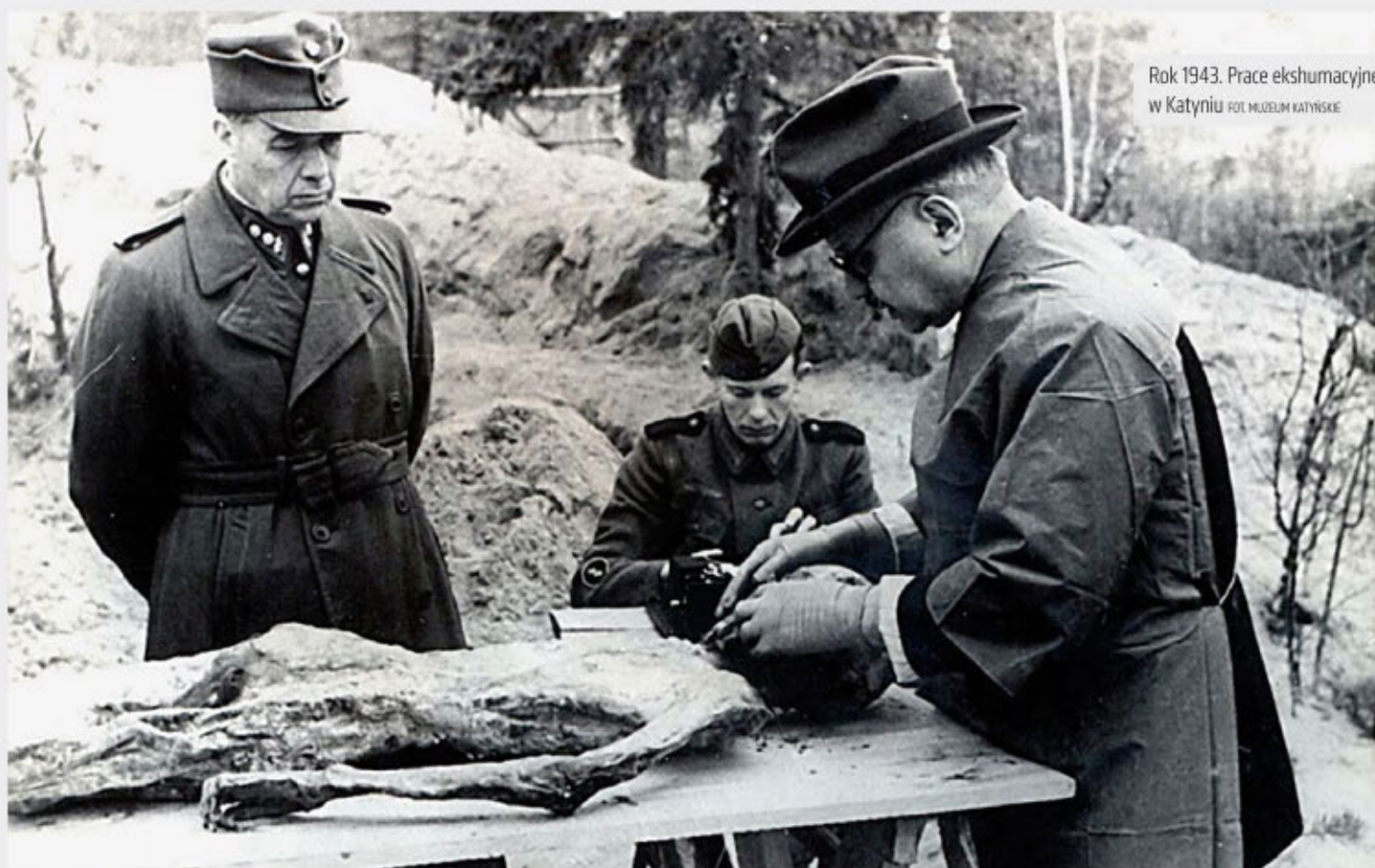
Rok 1943. Prace ekshumacyjne w Katyńiu.

Ten naród, niekoniecznie już wtedy „sowiecki”, się bał. Tym bardziej że w latach 1937–1938 władza nie mówiła ludziom o rozstrzelaniach, lecz jedynie o wyrokach po „dziesięć lat bez prawa korespondencji”. Dlatego ludzie myśleli, że chodzi o zsyłkę do łagrów, bo tak kłamała